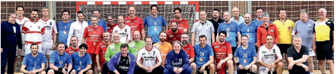
Alle Handball-Dinosaurier auf einem Haufen: Die Legenden (in Weiss) siegten vor Muri (in Rot) und Wohlen (in Blau).