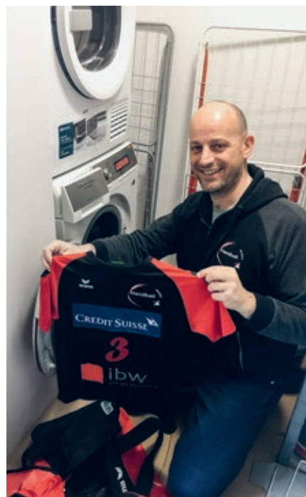
Laubi wäscht sogar die Trikots.

In ein paar Wochen an der GV im Juni ist es so weit und meine 14-jährige Amtszeit als Präsident von Handball Wohlen wird zu Ende gehen.