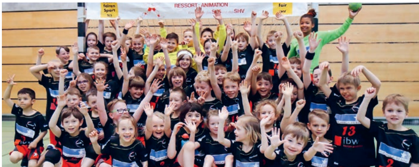
Unser Handball-Nachwuchs macht riesig Freude.

Unser Verein legt grossen Wert auf eine intakte und starke Nachwuchsarbeit. Hier eine Übersicht aller Teams im Juniorenbereich.