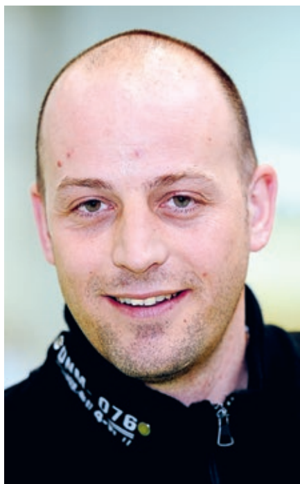
2010. Laubi in seinem ersten Amtsjahr.