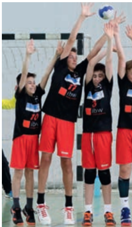
Monsterblock! Die Jungs der U13 sind ins Inter aufgestiegen. Viel Glück! Macht uns stolz.

Modus: Rang 1 und 2 kommen in die Aufstiegsrunde. Der Rest in die Abstiegsrunde.