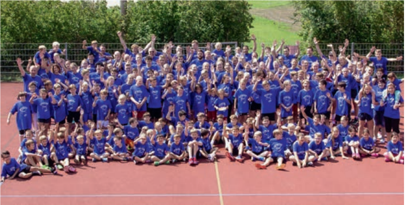
Das Vereinsbild zur Saisonöffnung 2019/20. Nächstes Jahr machen wir das Bild mit einer Drohne, weil ja kaum alle darauf Platz haben. LOL.