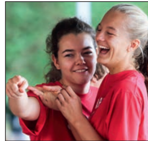
Was die beiden wohl gesehen haben?