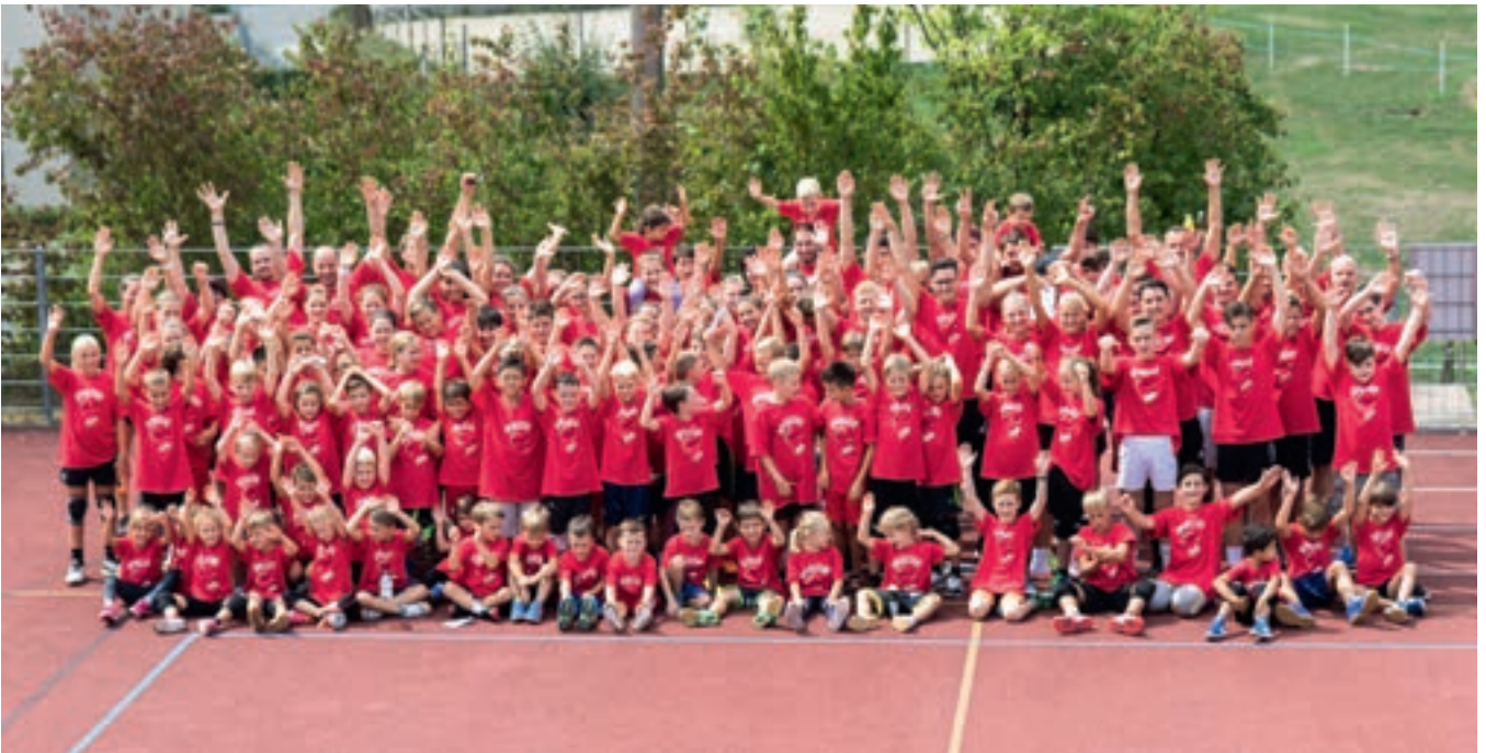
Alle auf einem Haufen: Das obligatorische Vereinsbild jedes Jahr anlässlich des Spieltages im August.