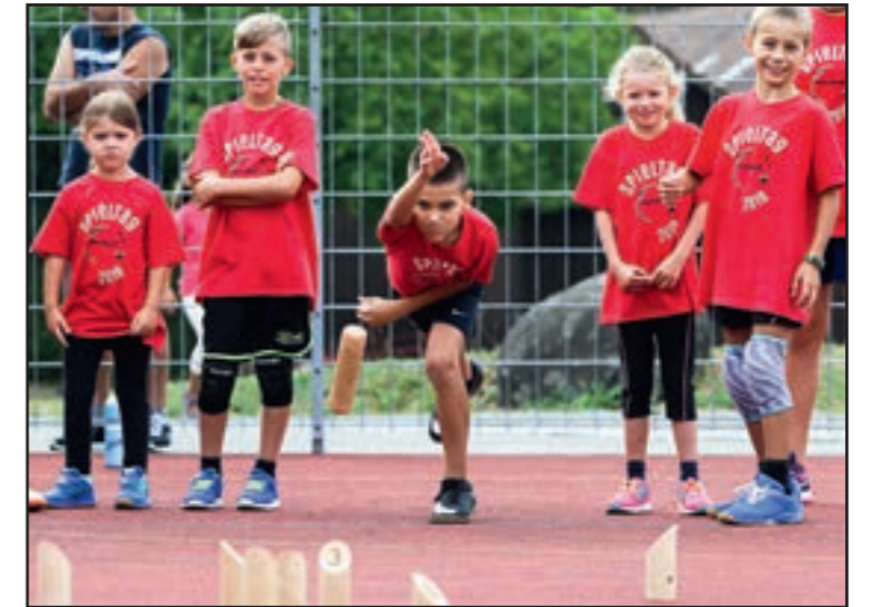
Dieser Wurf hatte die volle Aufmerksamkeit des halben Vereins.