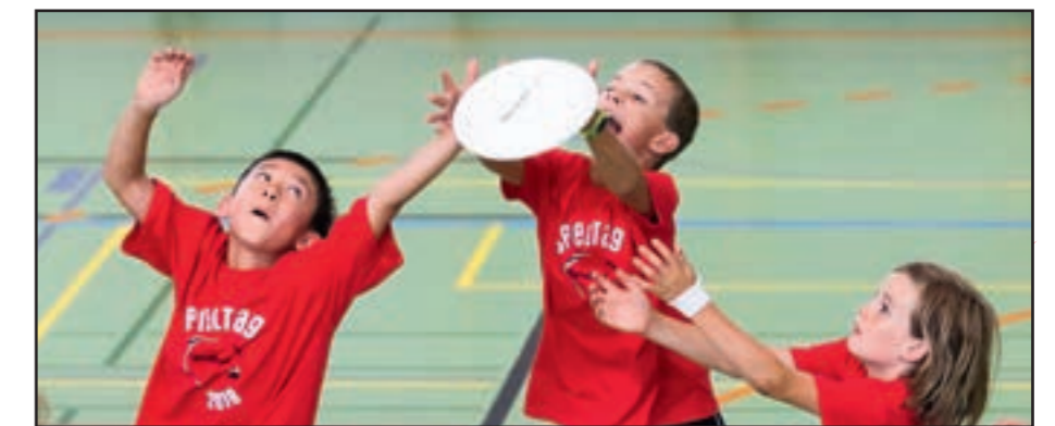
Wer erwischt die Scheibe?