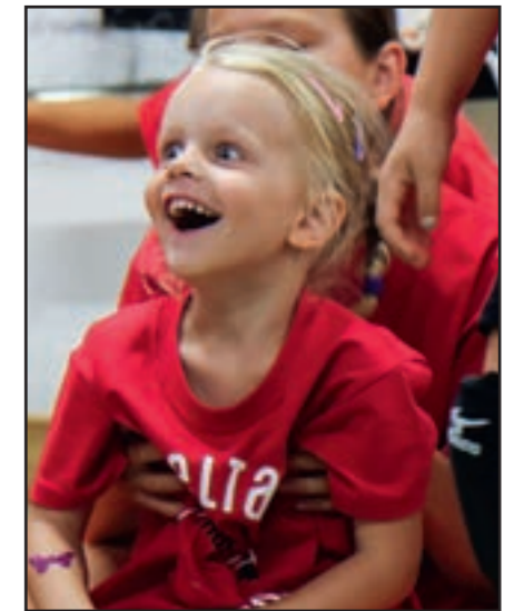
Keine Bildlegende nötig. Einfach genial.