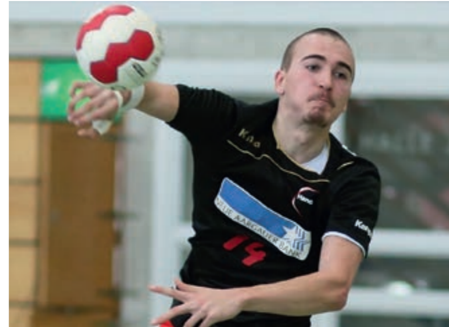
Die U19-Junioren haben in der Meisterklasse Erfahrungen gesammelt.

U13: Nach drei Vorbereitungsturnieren in Würenlingen, Muri und Rothrist startete die U13 im September in die Meisterschaft. Das Resultat war der zweite Rang. Die Fortschritte in den Trainings hatten dann auch Einfluss auf die Ergebnisse. Nach starken Leistungen folgte der Aufstieg in die stärkste Gruppenklasse. Gewonnen wurden die Spiele gegen Muri und Würenlingen, verloren wurden die Spiele gegen Endingen und Siggenthal. Die U13 hat noch Chancen auf den zweiten Tabellenplatz, dies wäre die Qualifikation für die Schweizer-Meisterschaften.