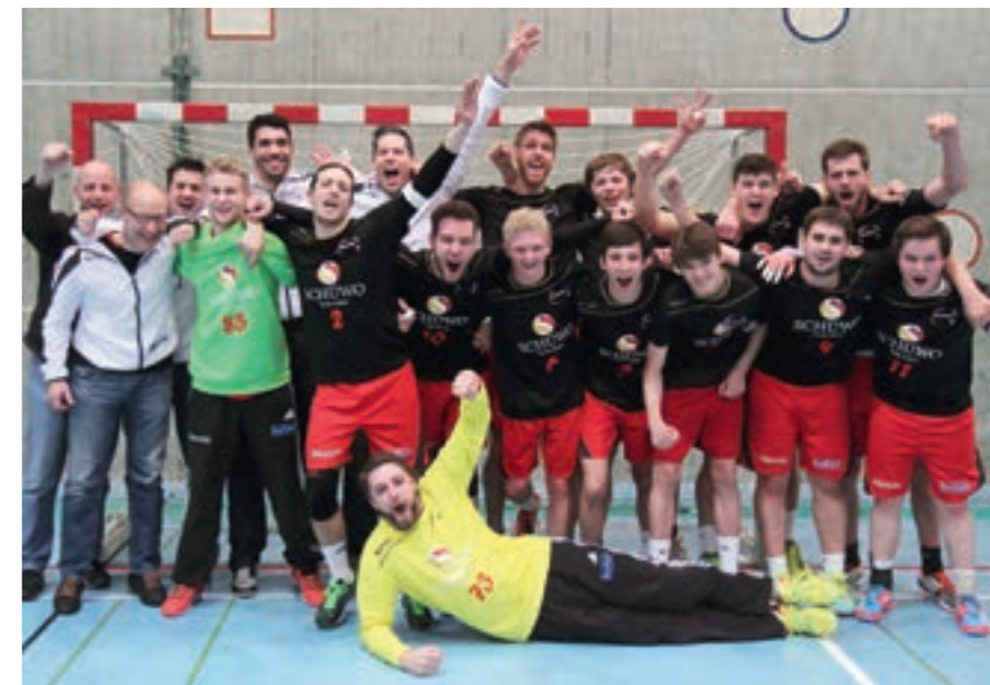
Nach dem Sieg in Lenzburg konnten die Wohler Handballer definitiv den 2.-Liga-Titel und den Aufstieg feiern.